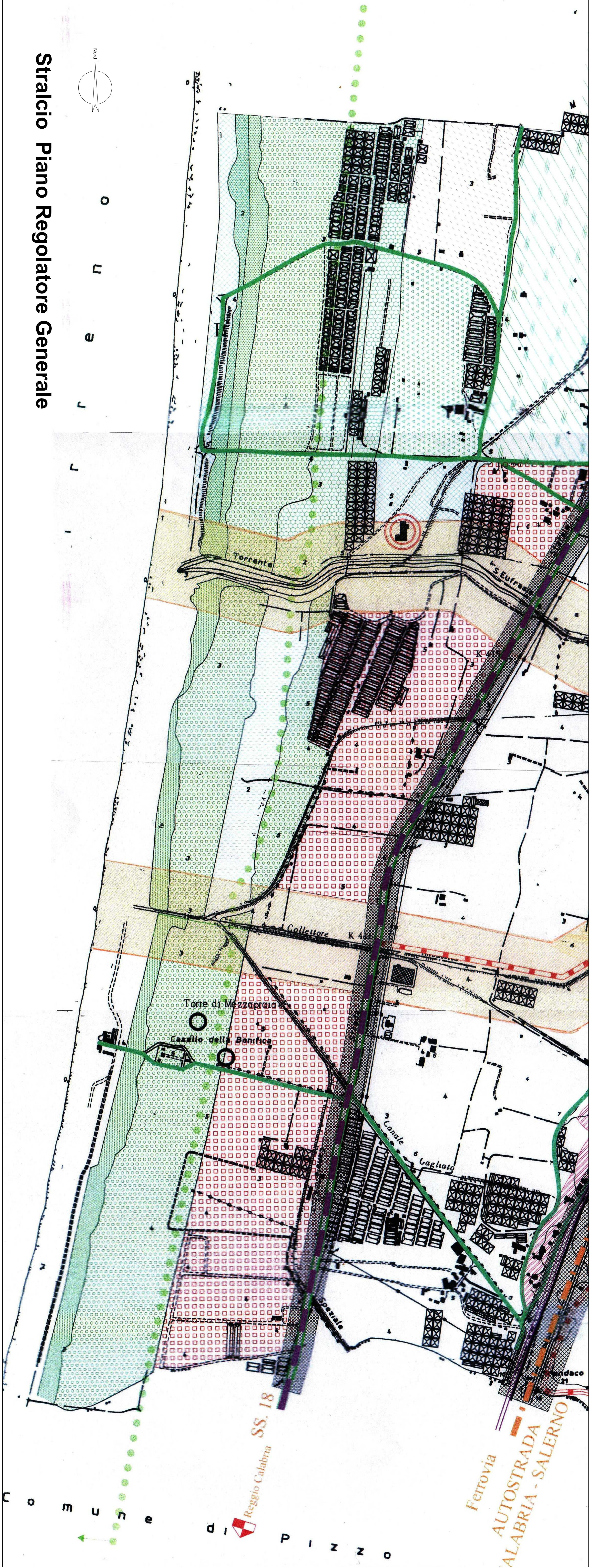
Stralcio Piano Regolatore Generale